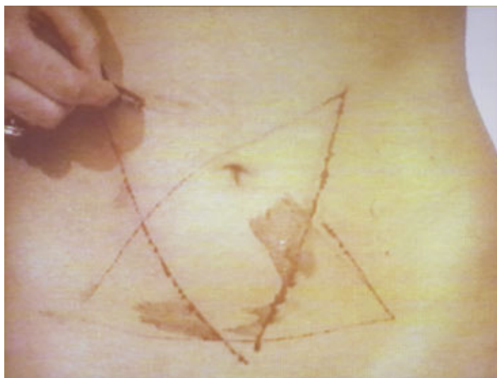
Marina Abramovic, Thomas Lips (The Star) , 1975-1993, Vidéo, couleur, sonore, Durée : 113, collection du FRAC Lorraine – 49 Nord 6 Est