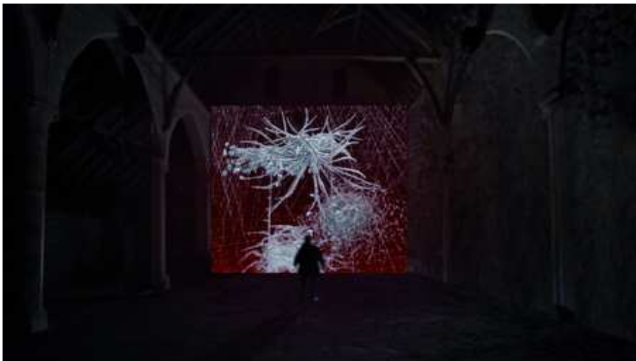
Miguel Chevalier, « Fractal Flowers », simulation pour la grange de l'abbaye © Miguel Chevalier

Du 12 septembre au 10 octobre aura lieu le point d'orgue du projet départemental du « Grand Pari(s) de l'art contemporain » : les œuvres créées dans ce cadre seront exposées dans les salles de l'abbaye de Maubuisson.