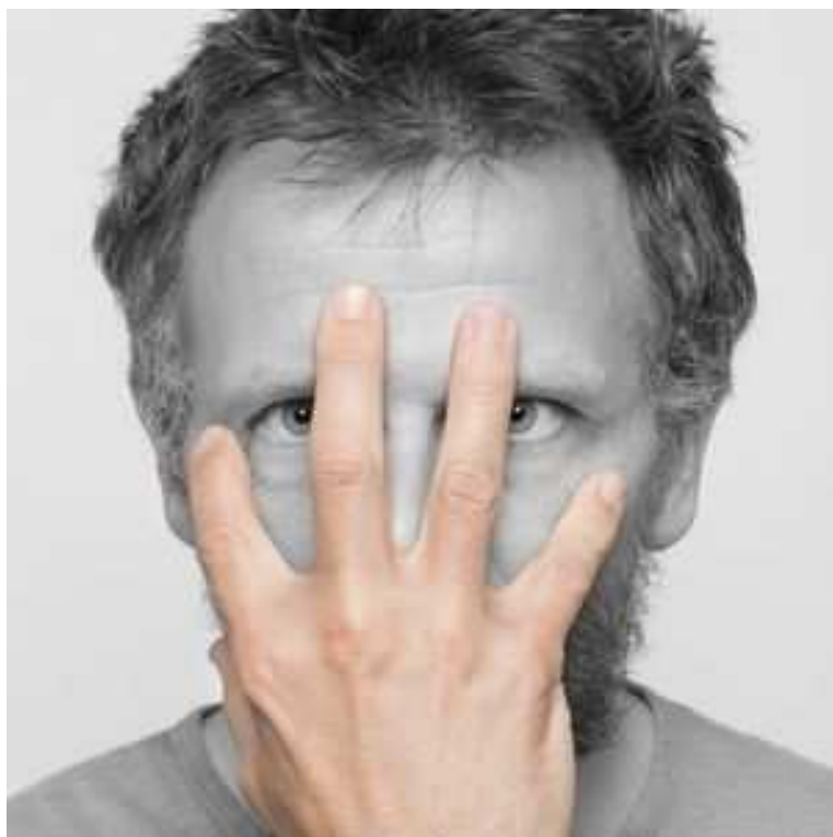
SMILE, la résidence du sourire

Samedi 25 et dimanche 26 septembre 2010 à 14h et 17h