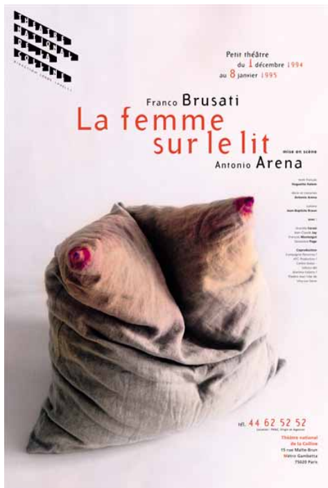
La femme sur le lit de Franco Brusati, Théâtre national de la Colline, affiche, 1994