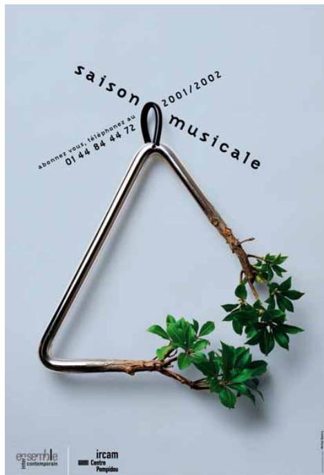
Ircam, saison musicale 2001/2002, affiche, 2001