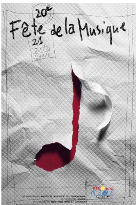
20 e Fête de la Musique, Ministère de la culture et de la communication, affiche, 2001