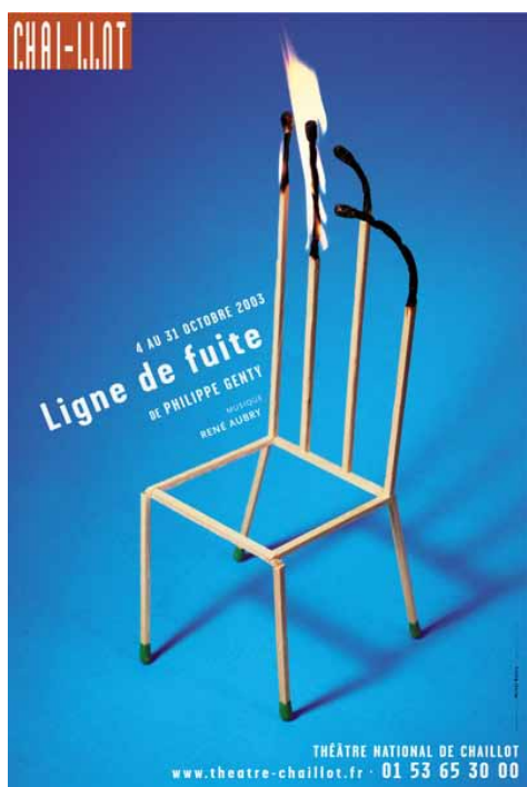
Ligne de fuite, Théâtre de Chaillot, affiche, 2003

APRÈS LE DUO DE GRAPHISTES ANTOINE ET MANUEL, C’EST AU TOUR DE L’AFFICHISTE MICHAL BATORY DE RÉPONDRE À L’INVITATION DES ARTS DÉCORATIFS. A TRAVERS UNE SÉLECTION D’UNE CENTAINE D’AFFICHES, C’EST TOUT L’UNIVERS CRÉATIF DE BATORY QUI EST AINSI RETRACÉ. ILLUSTRANT PRINCIPALEMENT LES DOMAINES CULTURELS DE LA DANSE, DU THÉÂTRE, DE LA LITTÉRATURE OU DE LA MUSIQUE, LES AFFICHES PHOTOGRAPHIQUES DE BATORY OFFRENT UNE RÉPONSE VISUELLE ORIGINALE OÙ DOMINE UNE POÉSIE IMPRÉGNÉE DE SURRÉALISME. L’ÉMOTION QUI EN RÉSULTE A MARQUÉ LES ESPRITS, INSCRIVANT AINSI SES IMAGES DANS LA MÉMOIRE COLLECTIVE.